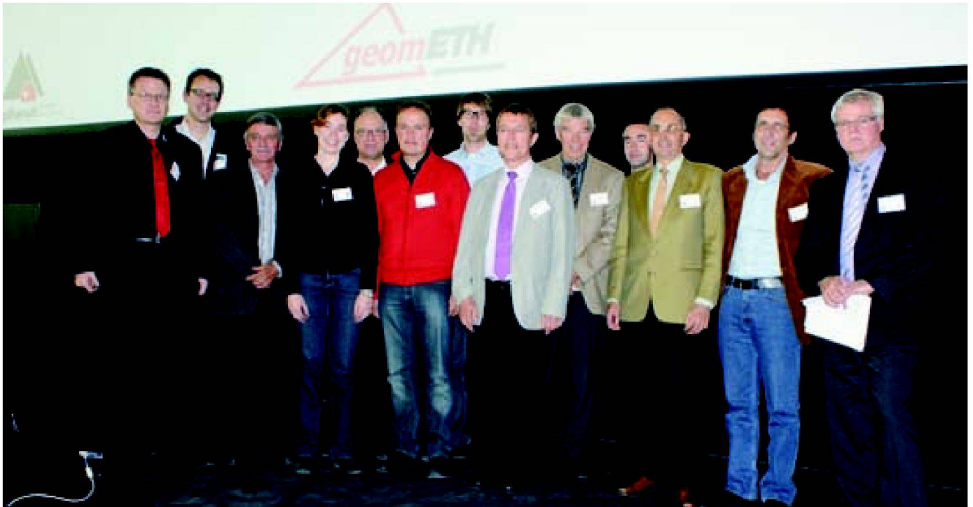
Abb. 3: Ehemalige und aktuelle Mitarbeitende des VI-GBT und der AlpTransit Gotthard AG.