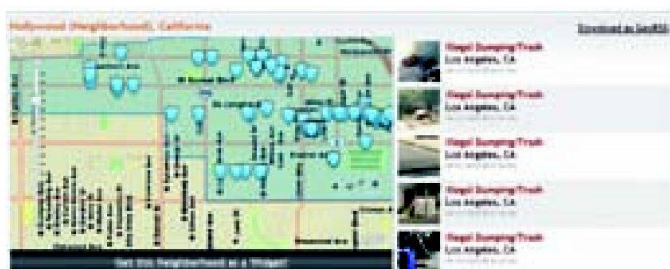
Fig. 1: Abandon de déchets encombrants à Hollywood.