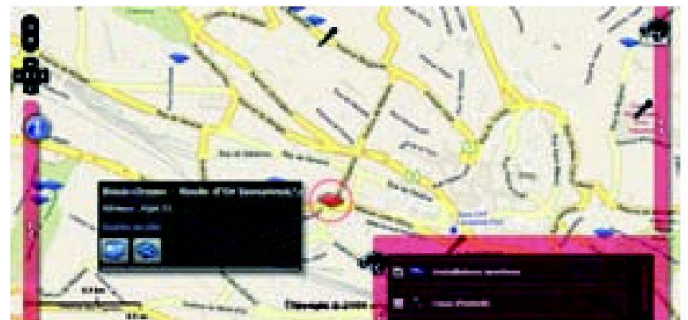
Fig. 3: Installations sportives à Lausanne.