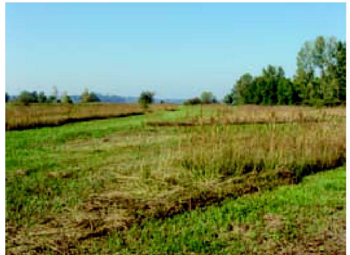
Abb. 1 und 2: Robenhauserriet mit Blick gegen Osten (links) und gegen Westen (rechts).

nalisieren und die Erschliessungswege zu reduzieren.