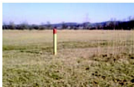
Abb. 6: Vermarkung der Grenzen mit gut sichtbaren Eichenpfählen.

pachtung führte die Fachstelle Naturschutz eine Umfrage bei den Bewirtschaftern durch und konnte so für Gerechtigkeit sorgen, wie auch geeignete Pächter aussuchen. Für die Vermarkung der Grenzen wurden meterhohe Eichenpfähle versetzt, die aber nicht zu hoch sein durften, um den Greifvögeln keinen Ansitz zu bieten. Das Wegnetz wurde gestrafft und mit den grösseren Parzellen erübrigte sich manche frühere Zufahrt. In der Randzone gegenüber dem Baugebiet