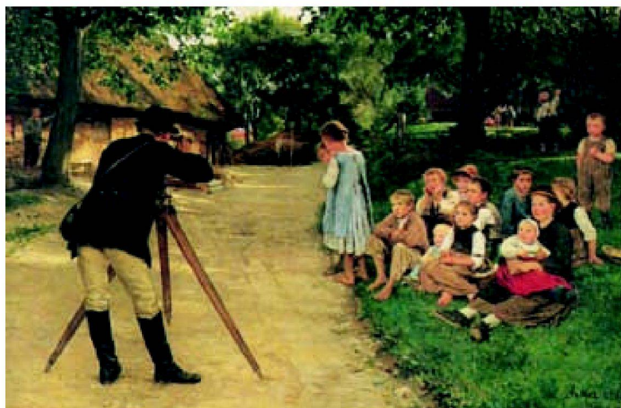
Albert Anker: Der Geometer, 1885 (Privatbesitz).