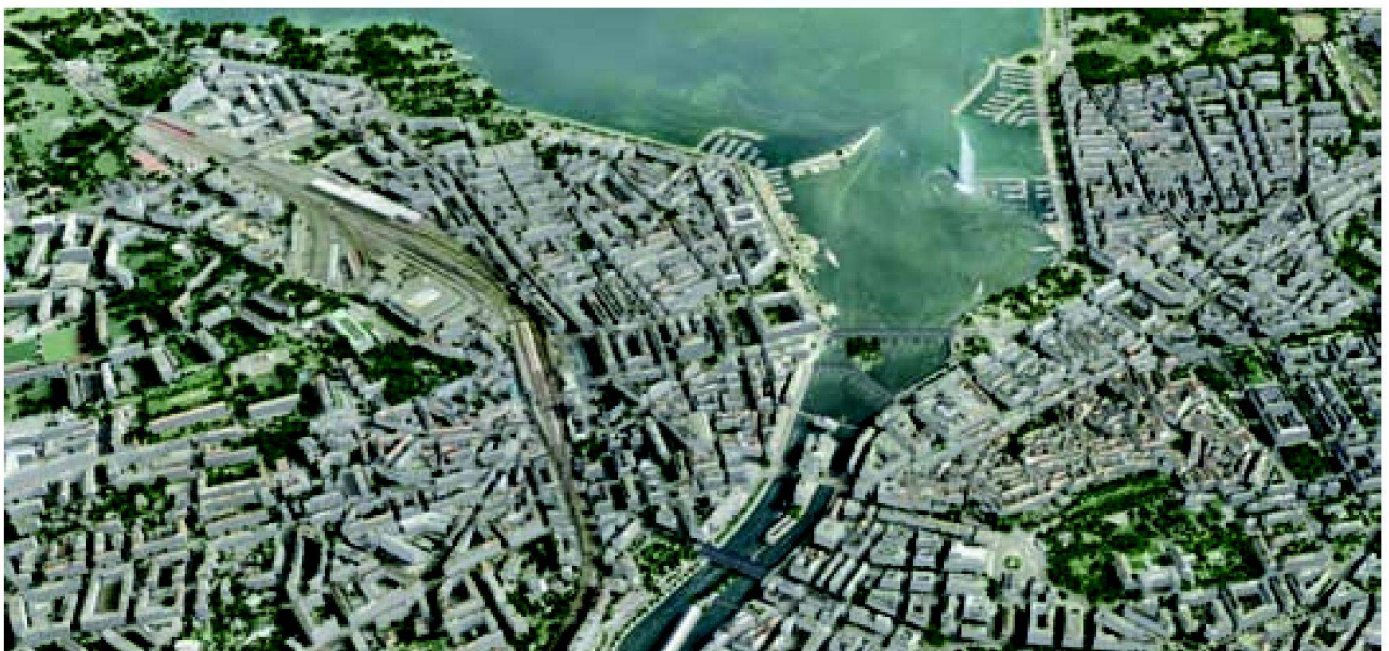
Fig. 1: Genève: Rade et centre ville (HEPIA/SITG).

Mis à part son utilisation classique de rendu visuel des bâtiments et de la ville – sous forme d'images, de maquettes en temps réel ou d'animations pré-calculées – la 3D va permettre de répondre à une multitude de besoins et attentes sous forme d'éléments chiffrés (indicateurs), de simulation (tests d'hypothèses) ou d'analyse spatiale 3D (carte de visibilité).