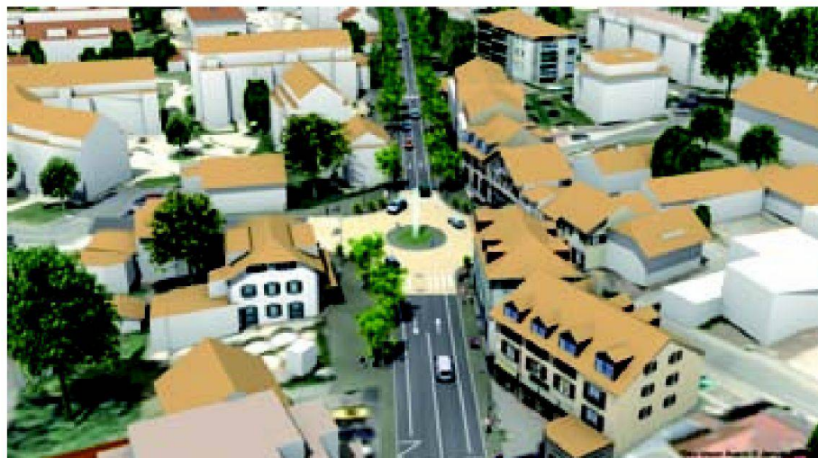
Fig. 4: Projet de traversée de Vésenaz (GVA/SITG).

Cette première étape révèle la démarche de base qui a été suivie. L'objectif est d'automatiser au maximum toute la procédure. En agissant de la sorte, l'argument «temps-énergie-coût» pour la création d'une maquette-socle tombe et garanti l'usage de données à jour. La logique est celle du «push», les données SIG sont poussées vers la maquette de visualisation. A l'heure actuelle, il n'y a pas de volonté de renvoyer des informations vers le SIG.