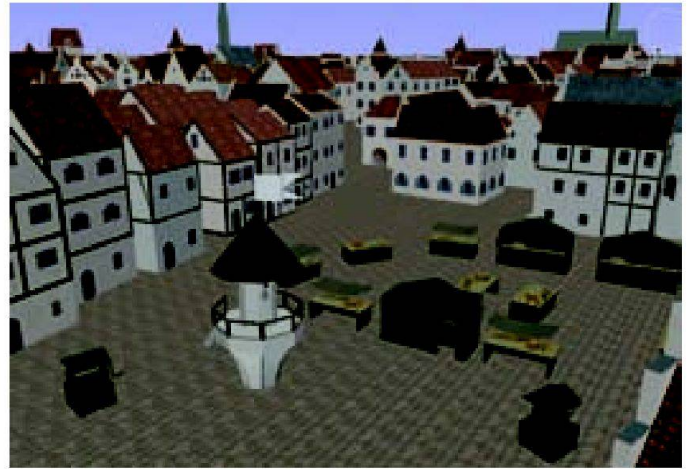
Abb. 1 und 2: Duisburg1566 (Quelle: Prof. Przybilla, Hochschule Bochum).