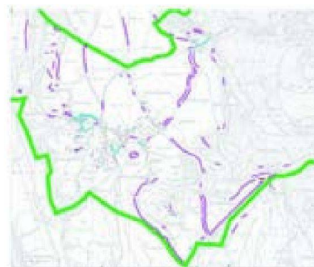
Abb. 2: Trockenmauern in der Gemeinde Paspels als Beispiel der Bestandenserhebung.

Im Rahmen eines Regionalen Vernetzungsprojektes Domleschg, getragen durch den Fond Landschaft Schweiz (FLS), Regionalorganisationen und kantonale Amtsstellen, wurden Trockenmauern erneuert und unterhalten. In Gesamtmeliorationen, Unwetterschadensbehebungen (über Meliorationskredite), Lehrlingseinsätzen (Maurerlehrlinge) wurden weitere Unterhaltsarbeiten geleistet. Grob überschlagen sprang zur Hauptsache die öf-