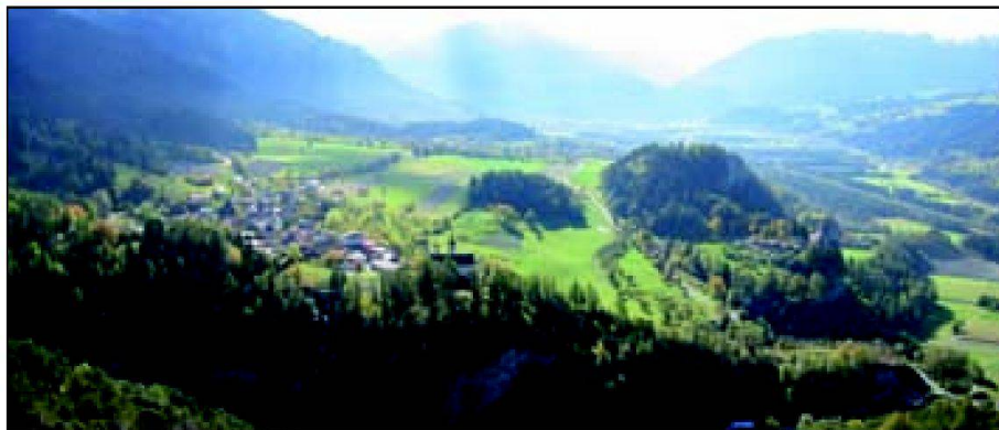
Abb. 1: Blick ins Domleschg von Nord nach Süd, links die Geländeterrassen mit den Dörfern Vorn Tomils, rechts die Hinterrheinebene und im Hintergrund der Einschnitt der Viamalaschlucht.

mauer ein notwendiges funktionales Instrument, das durch diese Gesellschaftsgruppe erstellt und unterhalten wurde. In der heutigen Gesellschaft und Landschaft ist die Trockenmauer nur noch marginal für die agrarische Nutzung notwendig (aus Sicht der Bewirtschaftung auch Hindernis). Hingegen sind die sekundären Trockenmauer-Funktionen massgebend, ob sich eine Landschaft als Erholungsraum oder touristischer Raum eignet. Dieser Paradigmenwechsel fordert eine neue Rollenverteilung insbesondere für den Unterhalt, in dem die Anbieter für die «neuen Nutzniesser» (Erholungssuchen-