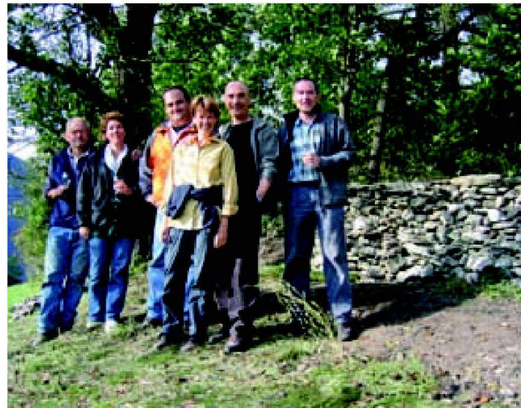
Abb. 5 und 6: Das Engagement der Kursteilnehmer zeigt Resultate. Wer ist da nicht stolz auf Vollbrachtes!

fentliche Hand direkt oder indirekt ein, zwar über lokale Initiative und Mitwirkung wie auch einige private Mitwirkende, deren Engagement nicht zu unterschätzen ist. Dabei kamen im Rahmen der Submissionsordnung auch lokale und überregionale Baufirmen und Spezialanbieter zu Aufträgen.