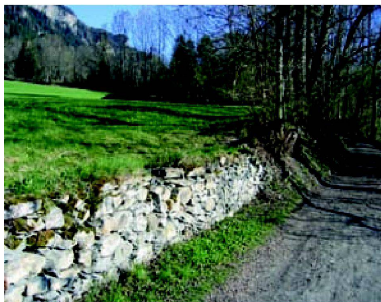
Abb. 3: Die klassische primäre Mehrfachfunktion der Trockenmauer: Stützen, Terrassenbildung, Abgrenzung, Linearelement entlang Weganlage (Gemeinde Almens).