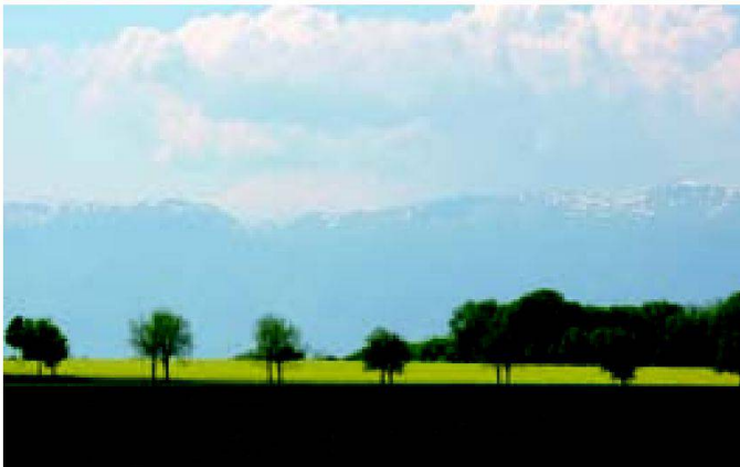
Fig. 5: Paysage avec allée (Jussy GE).