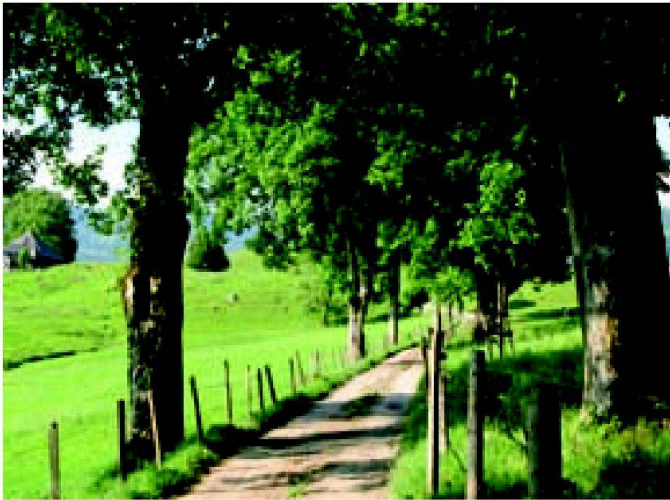
Fig. 3: Allée à La Monse (FR).