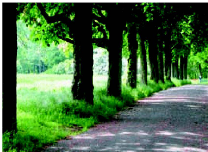
Fig. 1: Les allées sont un but de promenade prisé (Engadine, Berne).

Consciente du danger qui menace ce patrimoine paysager et historique, la Fondation suisse pour la protection et l'aménagement du paysage (FP) a réalisé et publié en 2008 une étude intitulée «Etat des lieux et importance des allées et paysages d'allées en Suisse». Celle-ci résume l'histoire des allées en Europe et en Suisse, décrit leurs différentes fonctions et en propose une typologie, introduit le concept