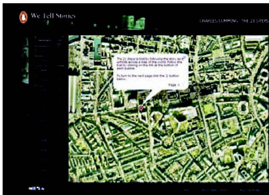
Geschichten mit interaktiven Karten: «We tell stories...».

stellten Tourguide können sie sich auf die Führten der literarischen Landvermesser begeben.