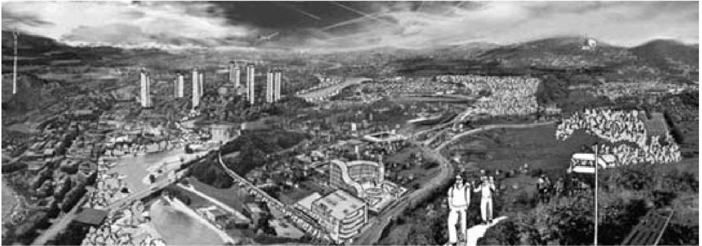
Abb. 1: Die am meisten gewünschten Entwicklungsoptionen für urbane Landschaften sind: Siedlungswachstum nach innen (dargestellt durch die Hochhäuser in der Bildmitte), effiziente ÖV-Systeme bis zum Agglomerationsrand (dargestellt durch den Park-and-Ride-Bahnhof im Vordergrund) und ökologisch aufgewertetes Siedlungsgebiet (dargestellt durch die Bäume, den Park vor dem Gewerbegebäude im Vordergrund und die Spaziergänger rechts vorne).

Die Befragten wollen die einzelnen Politikbereiche auch besser vernetzen. So soll beispielsweise die Agglomerationspolitik durch geschickte Gestaltung der urbanen Räume dazu beitragen, dass die Landschaft in den angrenzenden ländlichen Gebieten vermehrt freigehalten wird. Zudem sind die Befragten der Meinung, dass die Raumplanungsinstrumente noch gezielter für die Erhaltung und Aufwertung der Landschaft – insbesondere von Flusslandschaften – eingesetzt werden sollten.