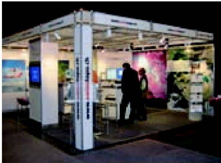
Abb. 4: Bundesamt für Landestopografie (swisstopo), Wabern-Bern.