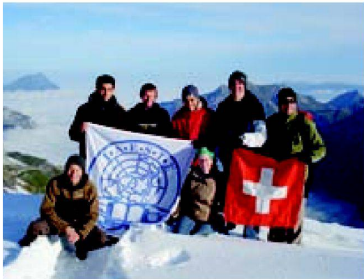
Praktikanten des IAESTE-Austausches entdecken die Schweiz.

lung werden von IAESTE kostenlos übernommen. Neben ihrer Arbeit können die Praktikanten an einem vielfältigen Freizeitprogramm teilnehmen, das die so genannten «Lokalkomitees» (Zusammenkünfte Studierender, die sich freiwillig für IAESTE engagieren) von Zürich, Basel oder Lausanne organisieren. Wenn erwünscht, übernehmen diese Lokalkomitees auch die Suche nach einer Unterkunft.