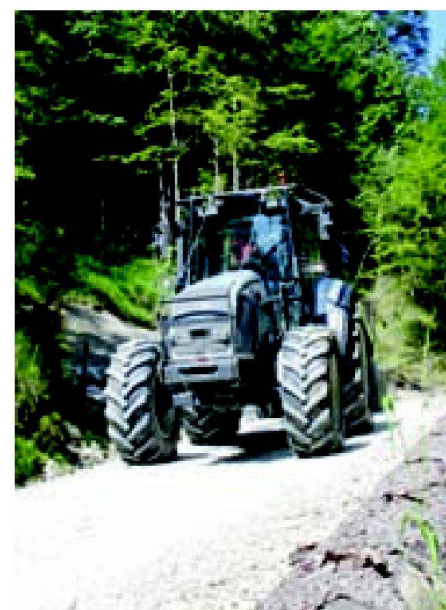
Fig. 2: Transport de bois (15 t) sur chemin gravelé en forte pente.

Sur la base d'un plan de gestion des alpages ou d'un regroupement d'alpages (voir La gestion intégrée des alpages), on