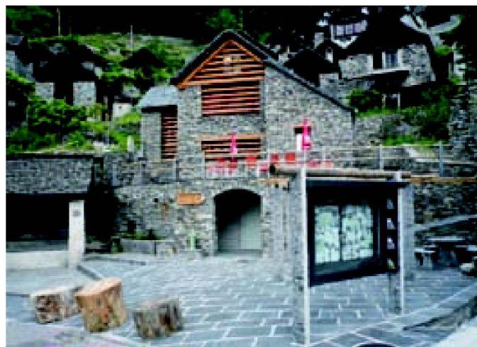
Abb. 3: Agrotourismus in Brontallo mit neuem Dorfplatz, Restaurant, Verkaufsladen, Weinkeller und Ferienwohnung.

gezeichnet worden. Insgesamt wurden 29 Wettbewerbsprojekte aus Belgien, Deutschland, Italien, Luxemburg, den Niederlanden, Österreich, Polen, der Schweiz, der Slowakei, Slowenien, Tschechien und Ungarn prämiert. Bewertet wurden neben der äusseren Erscheinung vor allem die «inneren» Qualitäten der Dörfer und Gemeinden wie eine angepasste wirtschaftliche Entwicklung, die Schaffung zeitgemässer sozialer Einrichtungen, die Auseinandersetzung mit Architektur, Siedlungsentwicklung, Ökologie und Energieversorgung oder kulturelle Initiativen und Weiterbildungsmaßnahmen.