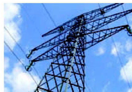
Fig. 2: Les lignes électriques peuvent parfois être une source de courants vagabonds.

Des sources de courants vagabonds en dehors de l'exploitation agricole sont possibles, et peuvent avoir une importance souvent insoupçonnée. Il a déjà été constaté sur des structures d'installations de traite proche de lignes de chemin de