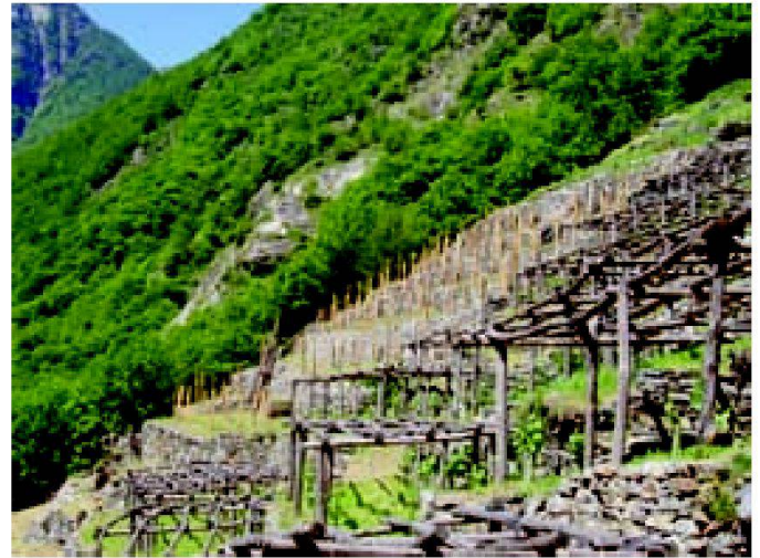
Abb. 4: Pergolareben alt und neu.

sie müssen für den Ressourcenschutz und den interkommunalen Ansatz sensibilisiert werden.