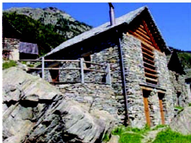
Abb. 2: Agrotourismus.