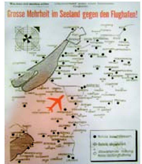
Abb. 7: Schutzverband gegen den Flughafen Grosses Moos.

Ausstellung Vision Seeland: Öffnungszeiten: Mo–Fr 8.00–18.00 Uhr Sa, So 10.00–16.00 Uhr