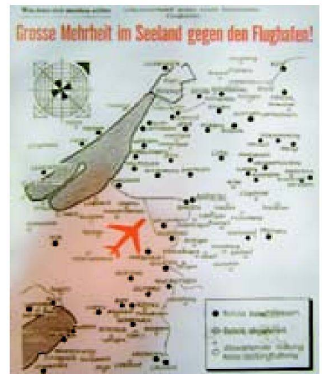
Abb. 7: Schutzverband gegen den Flughafen Grosses Moos.

Ausstellung Vision Seeland: Öffnungszeiten: Mo–Fr 8.00–18.00 Uhr Sa, So 10.00–16.00 Uhr