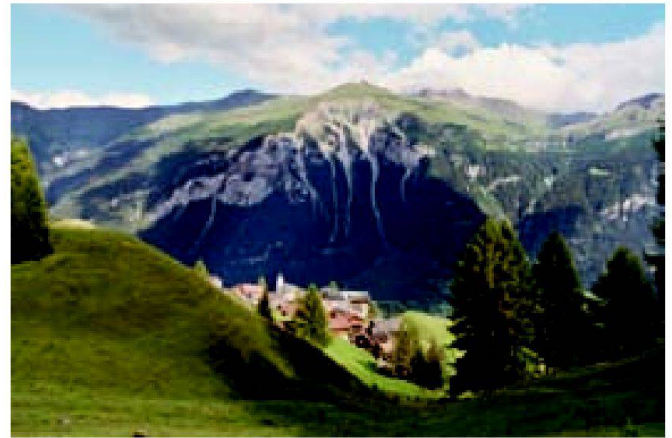
Abb. 3: Die Gemeinde Casti-Wergenstein hat ca. 50 EinwohnerInnen und liegt auf der Seitenmoräne eines einst mächtigen Gletschers, der von der Alp Anarosa aus ins Schamsertal vorgestossen ist.

schliessungsoptimierung anstreben. Welche Perspektive die Landwirtschaft im globalen Kontext hat, wird zuwenig grundlegend diskutiert. Kostennutzwert-Analysen stehen nicht im Vordergrund und andere Landschaftsinteressen werden kaum einbezogen. Auf der anderen Seite stehen Projekte wie das Center da Capricorns, die den natur- und kulturnahen Tourismus fördern. Projekte, die innovative, unternehmerische und nachhaltige Wege in die Zukunft des ländlichen Raumes vorzeigen. Es fehlen weitestgehend die gemeinsam abgestimmten Strategien, die viel Synergiepotenzial hätten. Denn Tourismus im ländlichen Raum ist ohne die Landwirtschaft nicht möglich und eine der grossen Zukunftschancen der Berglandwirtschaft liegt im naturnahen Tourismus.