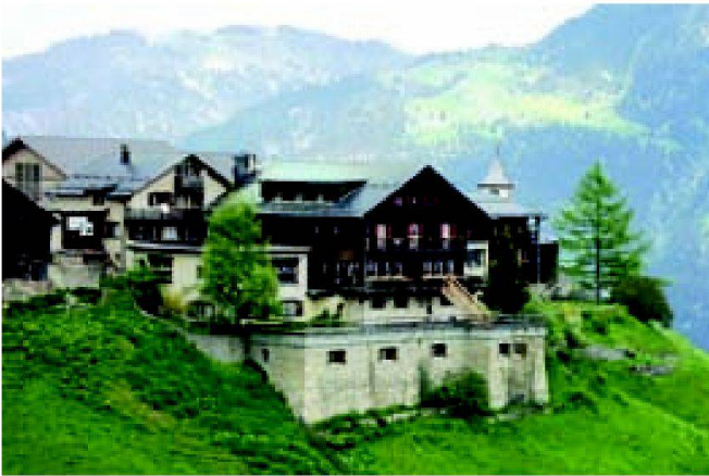
Abb. 2: Das Center da Capricorns, Hotel Piz Vizàn in Wengenstein: Hotel, Restaurant, Naturinfo-Zentrum und Arbeitsort der ZHAW Fachstelle Tourismus und Nachhaltige Entwicklung.