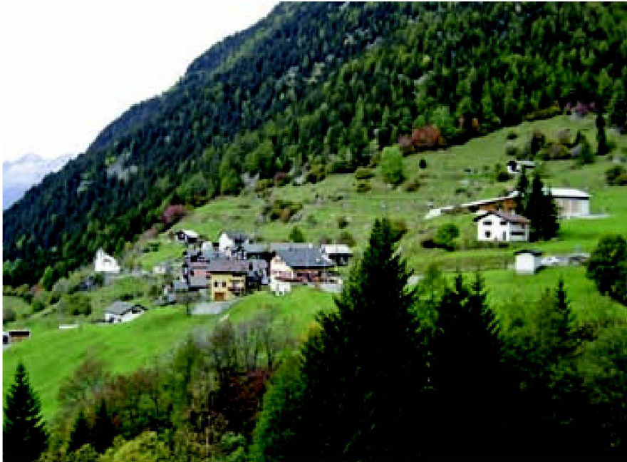
Abb. 1: Altanca, Valle Leventina (TI).

lungssystems wahrscheinlich, womit die Zielformulierung für die dezentrale Besiedlung und deren Umsetzung weitestgehend den Kantonen überlassen würde.