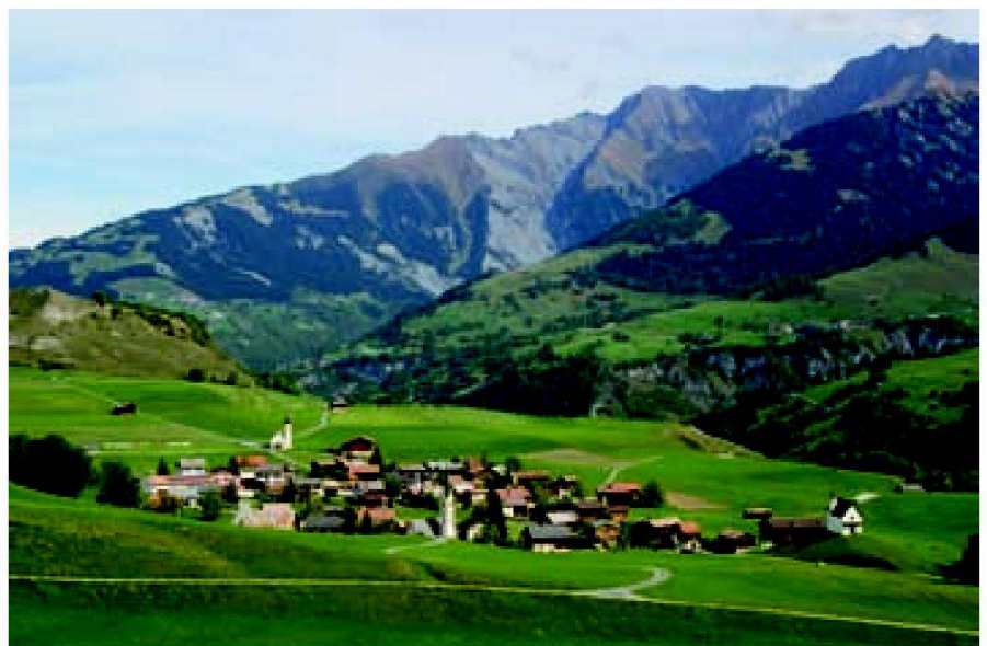
Abb. 2: Degen im Tal Lumnezia (GR).

Vor diesem Hintergrund liegt es an den betroffenen Kantonen sich zu überlegen, welche dezentralen Siedlungs- und Wirtschaftsstrukturen langfristig erstrebenswert sind. Unter dem Stichwort «Poten-