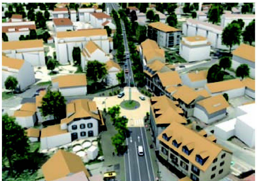
Fig. 3: Genève 3D.

En matière d'outils de politiques publiques, les apports de la troisième dimension constituent sans conteste une percée prépondérante. Tant pour ce qui concerne la gestion du territoire au quotidien, que pour la compréhension des projets, la concertation entre les collectivités, les élus et la population, mais aussi et surtout pour son aide à la prise de décision. La base de données 2D dont dispose Genève est déjà très complète (Système d'information du territoire genevois www.sitg.ch ). En intégrant des informations concernant les volumes réels, les hauteurs et les surfaces des objets, les autorités genevoises sont en passe de franchir un nouveau seuil. En effet, l'enrichissement des méthodes de représentation du territoire est un atout pour la mise en œuvre coordonnée des politiques publiques relevant notamment de l'aménagement du territoire, de la mobilité, de l'environnement, de la nature et du paysage, de l'agriculture et de l'eau.