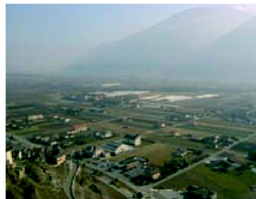
Fig. 6: Utilisation du sol à Saillon.

A la rédaction de cet article (août 2007), le projet AFI de Brigerbad-Raron a été mis en œuvre par décret par le Conseil d'état valaisan suite au plébiscite des propriétaires et exploitants du périmètre pour ac-