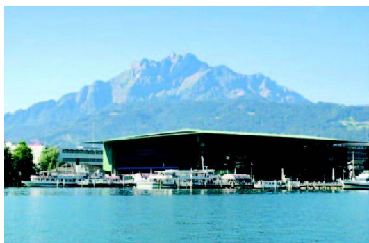
Luzern: Pilatus und KKL.

Die Medienbeobachtung «Argus» der PR-Gruppe wurde mit jener von swisstopo zusammengelegt. Sie erlaubt es, alle Publikationen in den Medien über die Themen Geomatik, Vermessung, GIS, Kulturtechnik, Landmanagement tagesaktuell zu verfolgen. Alle Artikel werden im Archiv gespeichert. Der Zugang ist für alle Mitglieder über www.geomatik.ch «News» und den Homepages der Geomatik-Verbände möglich.