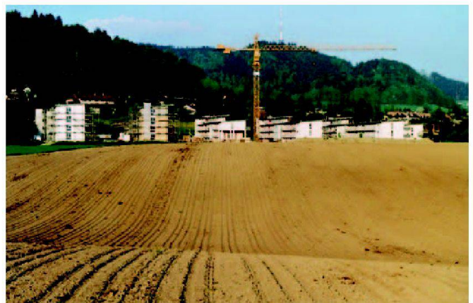
Abb. 2: Die rasante Siedlungsausdehnung bedrängt die landwirtschaftliche Nutzfläche.