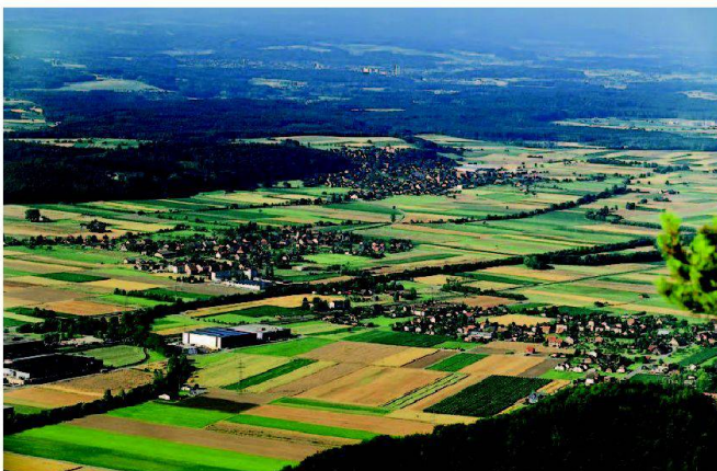
Abb. 1: Ist eine Erweiterung von Arbeitszonen sinnvoll?

Die Richtpläne stellen das wichtigste Koordinationsinstrument der Kantone für