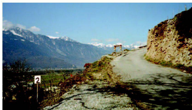
Fig. 2: Chemin no 1, accès vers les Hauts du syndicat.

Le projet d'exécution a été établi sur la base d'un relevé photogrammétrique au 1:500 et selon les lignes directrices de