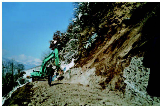
Fig. 4: Accès intermédiaire et purge des falaises.

l'avant-projet des travaux collectifs établi au 1:2000. De nombreuses difficultés sont vite apparues.