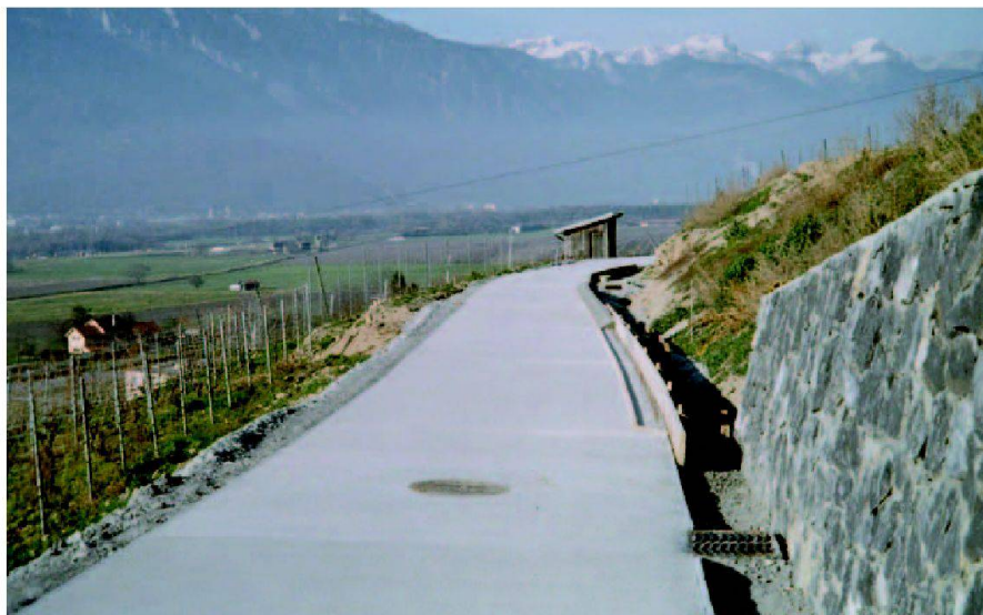
Fig. 5: Une infrastructure adéquate.

Une partie des chemins a été réalisée avec un revêtement en béton, alors que d'autres parties présentent un revêtement gravelé. Sur un tronçon en pente ou sinueux d'un chemin gravelé, une application bitumineuse bi-couche, complétée par la pose de rigoles transversales, assurent la stabilité.