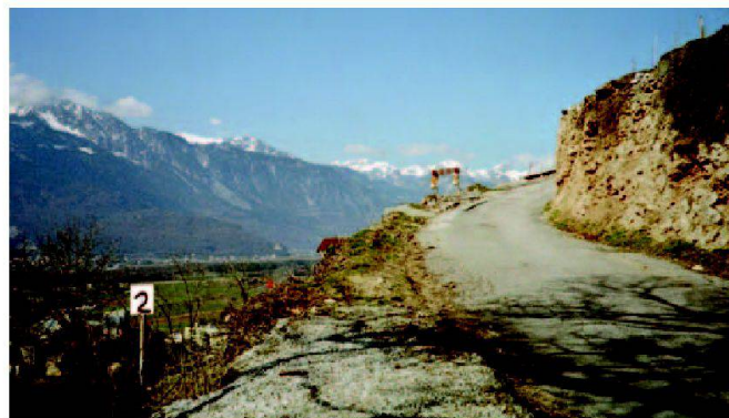
Fig. 2: Chemin no 1, accès vers les Hauts du syndicat.