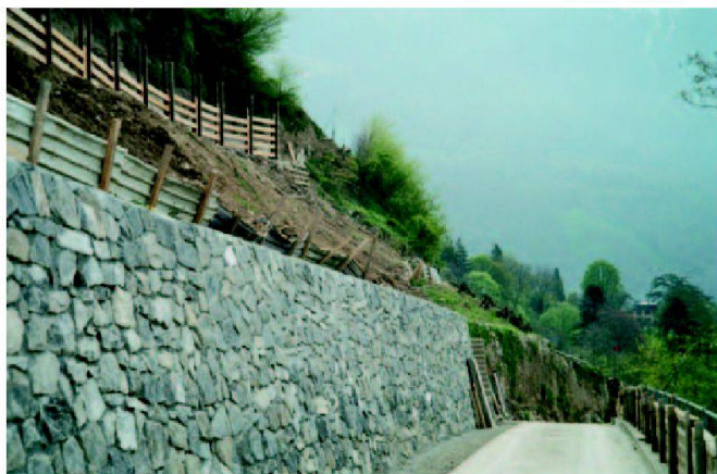
Fig. 3: Chemin de base avec consolidation des sols.