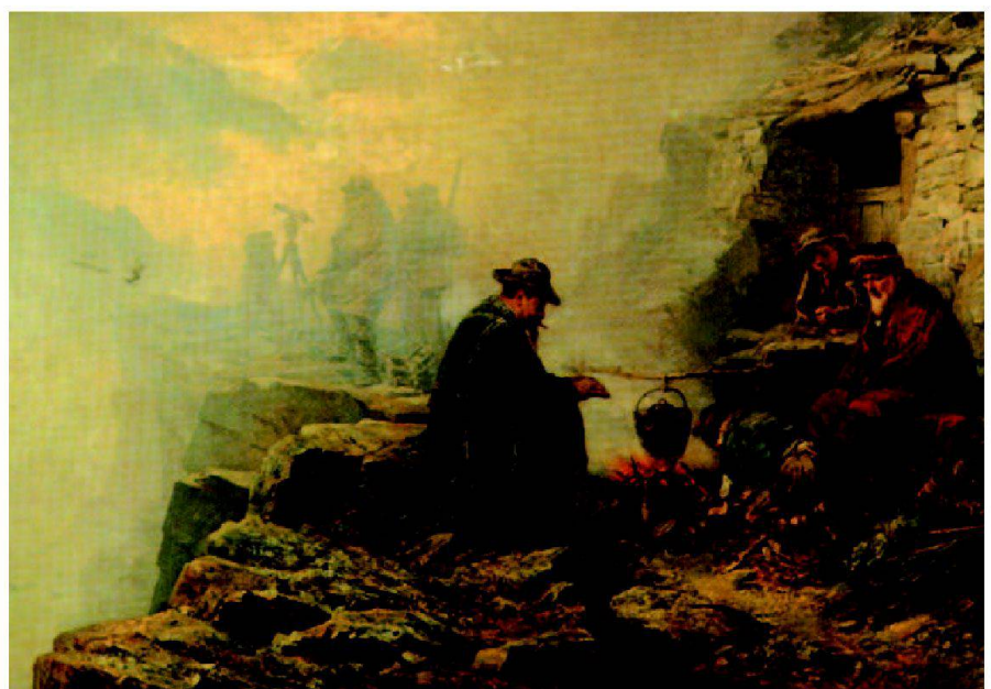
Abb. 2: Warten auf bessere Sichtverhältnisse im oberirdischen Triangulationsnetz (R. Ritz um 1880).

1869 beschloss das Gotthard-Comitee, der schweizerischen Geodätischen Kommission den Auftrag für die vorzeitige Erstellung der Linie über den Gotthard des «Nivellement de précision» zu erteilen. Noch im gleichen Jahr wurde dieses Nivellement von Süden nach Norden gemessen. Gelpke entschloss sich dann ebenfalls 1869, mit seiner Triangulation auch die Höhenwinkel zu messen. Bei der Berechnung ergab sich bei einer Differenz von 9.7 cm zwischen Nivellement und trigonometrischer Höhenübertragung eine hohe Übereinstimmung. Auch Koppe führte mit seiner Triangulation gegenseitige Zenitdistanzmessungen zur Überprüfung des Nivellements durch. Sein Ergebnis deckt sich mit jenem von Gelpke. Gelpke hat sich auch mit der Problematik des Refraktionskoeffizienten im Hochgebirge auseinandergesetzt. Zum Thema Lotab-