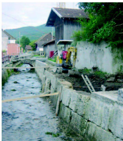
Fig. 5: Canal en rénovation.

Yves Leuzinger lic. es sciences et ingénieur environnement HES bureau Natura animateur du projet Soulce Saucy 17 CH-2722 Les Reussilles BE leuzinger@bureau-natura.ch