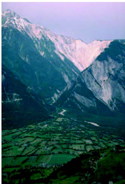
Fig. 1: Le cirque torrentiel de l'Ilgraben et le cône d'alluvion de la Souste recouvert d'un bocage.

L'autoroute du Rhône, entre Sierre et Loèche, n'échappe pas à cette évolution de la sensibilité. Planifiée, dans les années 1960, comme axe routier, approuvée en 1991 comme concept de transport impli-