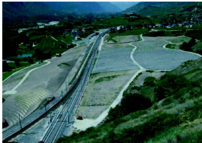
Fig. 6: Les matériaux d'excavation des tunnel CFF servent d'assise aux nouvelles voies pour la traversée d'une combe viticole.

respecter l'existant. L'importance des coûts liés à ces mesures préventives a incité les autres à suggérer une approche globale, cohérente. Pourquoi investir 40 millions de francs supplémentaires par kilomètre de galerie si les exploitations existantes poursuivent leurs activités destructrices? L'approche proactive l'emporta sur la démarche défensive lorsque l'Office fédéral des routes (OFROU) et l'Office fédéral des forêts, de l'environnement et du paysage (OFEFP) acceptèrent de reporter le devis d'un demi kilomètre de galerie sur des mesures de compensation ambitieuses visant à restaurer l'ensemble de Finges: revitalisation de la zone alluviale, protection et agrandissement des étangs, soutien des exploitations agricoles traditionnelles et construction d'un accès pour les piétons à travers le Rhône, en remplacement des accès routiers supprimés.