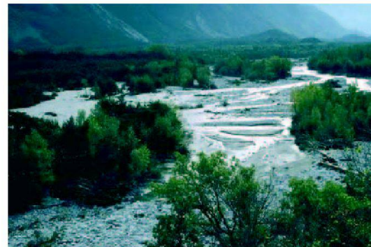
Fig. 2: Au premier plan le Rhône sauvage de Finges et, au loin, les collines de l'éboulement préhistorique.

quant une permutation des axes ferroviaire et routier, conçue finalement comme outil de restauration paysagère et écologique du site, la traversée autoroutière de Finges aura contribué à une révolution des mentalités et sera vécue comme le premier parc naturel régional du Valais sous le leitmotiv «durabilité». L'analyse de ce tronçon de route nationale sous l'angle du développement durable suppose quelques informations préalables sur le site et le projet.