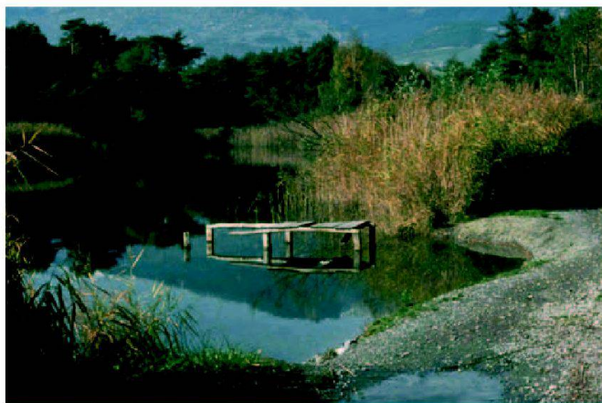
Fig. 3: Etangs avec ponton et berge érodée: l'utilisation des étangs pour les loisirs érode la végétation riveraine.

Durant la phase d'étude du projet au 1/1000e, l'enfermement dans une attitude défensive a poussé les uns à demander un effort d'intégration supplémentaire par allongement des galeries afin de