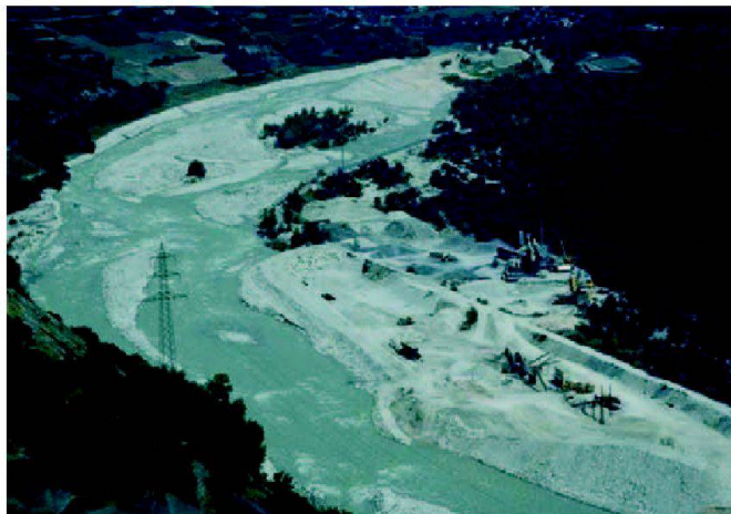
Fig. 5: Une des gravières exploitant les alluvions du Rhône sauvage entre Loèche et Sierre.