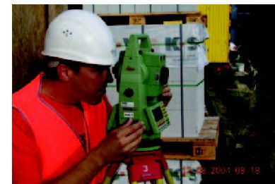
Kluge Köpfe schützen sich! Der VSVF ist dabei!