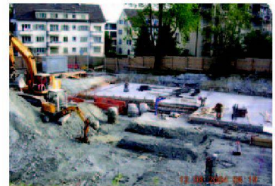
Bei schweren Baumaschinen: Immer Helm auf!