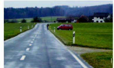
Keine korrekte Sicherung gegenüber dem Strassenverkehr.