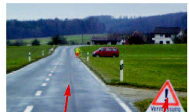
Die Sicherung gegenüber dem Strassenverkehr ist regelkonform.