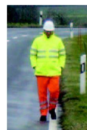
Auch wichtig sind Warnkleidungen. Sichtwesten sollten in jedem Fahrzeug vorhanden sein!