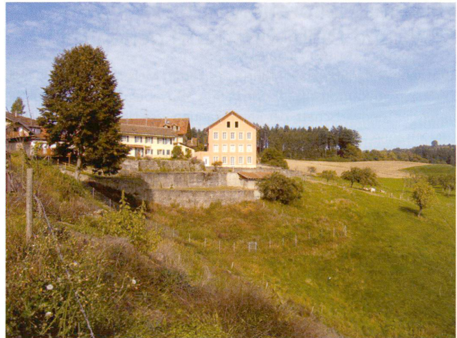
Abb. 2: Durch die Güterzusammenlegung und das Erstellen neuer Erschliessungswege können nicht nur eine sinnvolle Landwirtschaft und entsprechende Zonen, sondern auch das für Mont-sur-Lausanne charakteristische Landschaftsbild erhalten werden.

weiterhin Raum für die Siedlungsentwicklung bereitgestellt werden. Kurzum: Das Ziel besteht in einer nachhaltigen Entwicklung des Lebensraums.