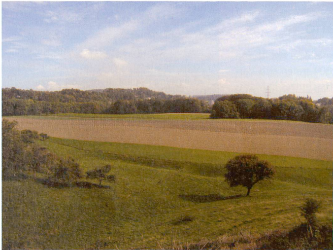
Abb. 1: Viele Hecken und Obstgärten prägen das Landschaftsbild von Mont-sur-Lausanne, das denn auch zum Naherholungsgebiet von Lausanne zählt.