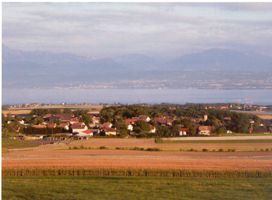
Fig. 2: Lavigny (VD).

mique (montage financier). Il ne doit pas figer un état futur, mais au contraire être prospectif et contribuer à la maîtrise, par la collectivité locale, des situations présentes et futures. Il doit bien évidemment inclure l'espace agricole, à défaut de quoi l'agriculture sera la grande perdante de l'opération, trop souvent réduite alors à ce qui reste quand on a fait tout le reste. Elaborer un tel projet n'est toutefois pas œuvre facile! Cela nécessite d'apporter des réponses à des questions de société aussi fondamentales que: quelle agriculture voulons-nous, ou quel paysage souhaitons-nous?