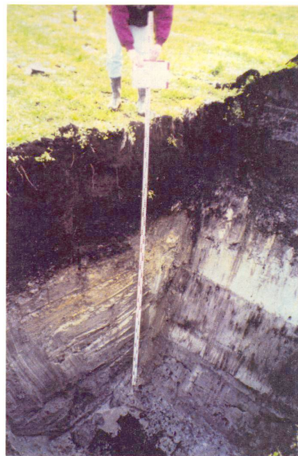
Profil de sol caractéristique.