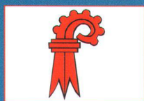
Kanton Basel Landschaft

Diese Kantonalen Vermessungsämter haben sich für Grivis-Geos, basierend auf GeoMedia Professional, entschieden: