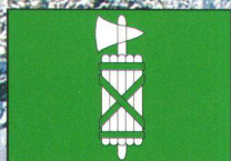
Kanton St. Gallen