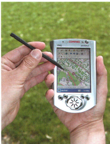
Fig. 4: Géodonnées mobiles.

Vous retrouverez l'essentiel de ces informations en parcourant la brochure qui accompagne notre programme e-geo.ch.