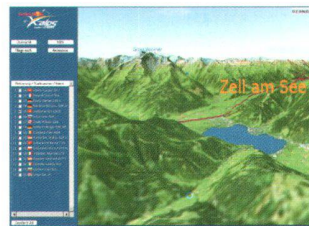
Abb. 2: Red Bull X-Alps, GPS-getrackte Fluglinien bei Zell am See. 3D-Ansicht basierend auf einem Satellitenbild.