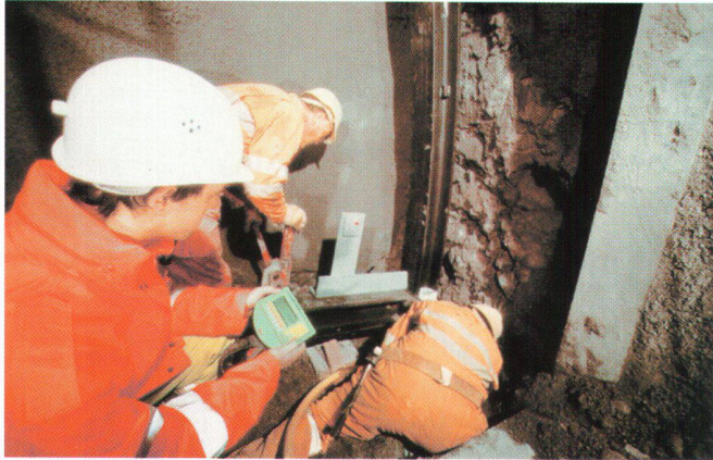
Einbau eines Stahlbogens im Lockergesteinsvortrieb. TMS SET-OUT PLUS im Einsatz durch die Vortriebsmannschaft.

TMS SETOUT, das on-board-Multifunktionswerkzeug für die Tun-