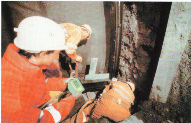
Einbau eines Stahlbogens im Lockergesteinsvortrieb. TMS SET-OUT PLUS im Einsatz durch die Vortriebsmannschaft.

TMS SETOUT, das on-board-Multifunktionswerkzeug für die Tun-