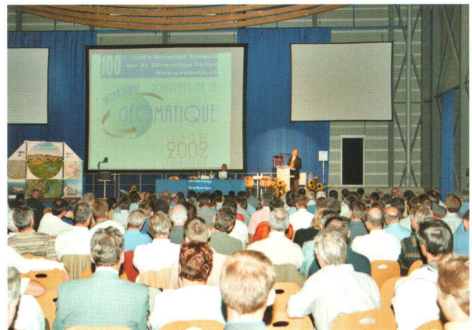
Bilder vom Geomatik-Kongress «100 Jahre Geomatik Schweiz – Geomatik für unsere Zukunft» mit Bundesrat Joseph Deiss im Rahmen der Geomatiktage 2002, 14. Juni 2002, Forum Fribourg.