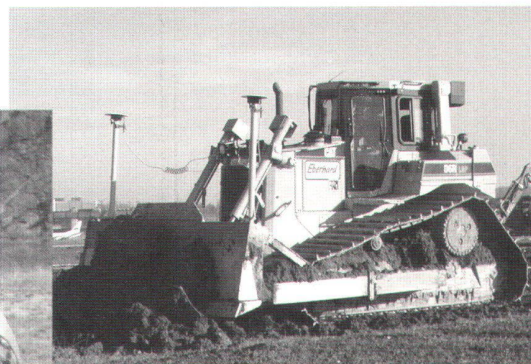
SiteVision - Automatische Maschinenführung