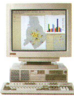
ALPHASTATION 250 Workstations von DEC mit kompromissloser Leistungsfähigkeit.

Die 64-Bit-RISC-Technologie bietet nahezu uneingeschränkte Kapazität zum wirklich günstigen Preis. Beispielsweise auch die dreifache Hardware-Gewährleistung von DEC, die zu den äusserst geringen Unterhaltskosten der AlphaStations beiträgt.