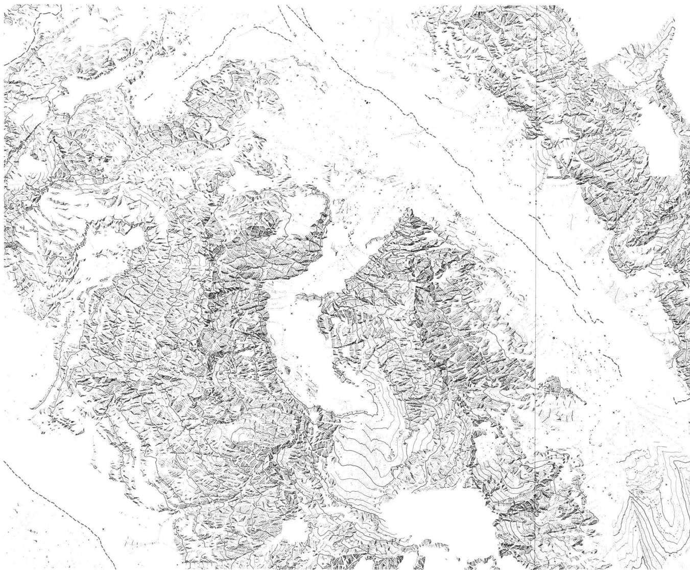
Abb. 3: Topographische Karte 1:25 000 «Panta» in der Cordillera Vilcabamba, Peru. Aufgenommen anlässlich der Andenexpedition 1959 des Schweizer Alpen-Club nach dem Verfahren der terrestrischen Photogrammetrie im Juni und Juli 1959. Aufnahme, Gesamtedaktion der Karte und Gravur der Felsgebiete und Eisbrüche durch Ernst Spiess. Die Abbildung zeigt einen Ausschnitt aus der Felsgravur im zentralen Kartenteil.

Ein Ausschnitt des greifbaren Erlebnisses dieser Expedition liegt dieser Festschrift bei: ein Ausschnitt Deiner Karte der Panta-Gruppe 1:50 000, für die Du das zu kartierende Gebiet festgelegt, im Alleingang in wochenlanger Arbeit über 50 Haupt- und Passpunkte und 28 Basislinien zwischen 4200 und 4830 m über Meer eingemessen und 360 Photoplatten mit einem Wild Phototheodo-