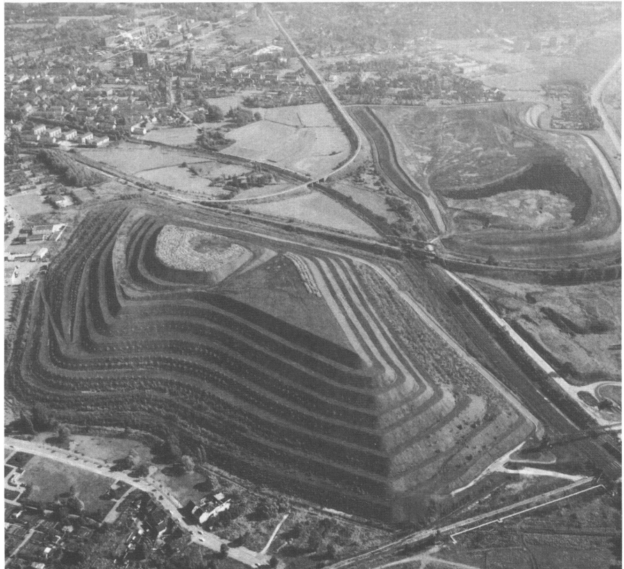
Abb. 4: Bergehalde der zweiten Generation in der Emscherzone, 1982.

Die im Frühjahr 1990 angelaufene weitere Planung des Emscher Landschaftsparks