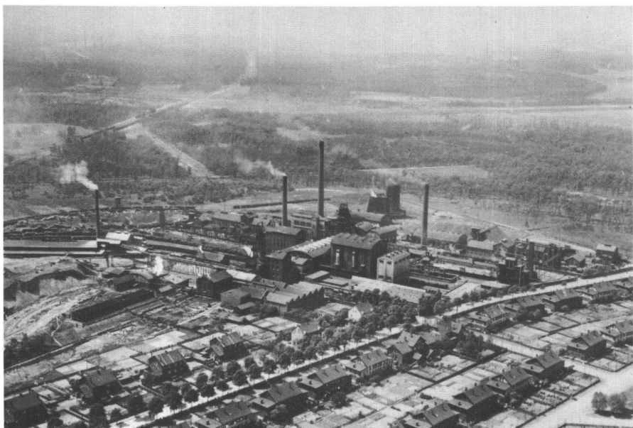
Abb. 2: Recklinghausen, Zeche Recklinghausen II, 1926. Zechenanlagen und die ihnen direkt zugeordneten Bergarbeitersiedlungen überformten seit dem letzten Drittel des 19. Jahrhunderts die Bruchwälder im Emscher- tal und die bäuerliche Kulturlandschaft zwischen Emscherbruch und der Lippe.