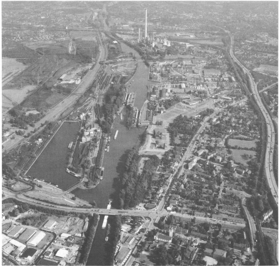
Abb. 3: Herne-Crange, Rhein-Herne-Kanal mit Schleuse und Hafen, 1987. Emscher, Rhein-Herne-Kanal, Bahnlinien und Autobahn A 42 bilden in Ost-West-Richtung ein dichtes Bandinfrastruktur-Bündel, das Siedlungsbereiche und Freiflächen als «Inseln» einschliesst. Untergenutzte Häfen, Industriebrachen und Kohlenlagerplätze stellen wichtige Flächenpotentiale für die Rückgewinnung von Freiraum und eine Aktivierung der Kanalufer für Freizeitnutzungen dar.

Er integriert viele städtebauliche Einzelprojekte, bindet sie in eine städteübergrei-