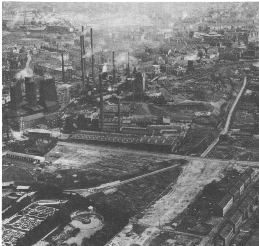
Abb. 1: Essen-Nordstadt, 1927. Eine enge Gemengelage von Zeche, Kokerei und Wohnblocks war Folge einer ungeplanten Siedlungsentwicklung. Bergsenkungen, ungeordnete Aufhaldungen und als Abwassersammler kanalisierte Bachläufe prägen bis heute weite Teile der Emscherzone.

Einen gebündelten Impuls, der diese An- sätze verstärken und bis zum Jahr 2000 wirksam umsetzen soll, gibt die «Internationale Bauausstellung Emscher Park». Dieses Projekt der Landesregierung von Nordrhein-Westfalen, bei dem 17 Städte zwischen Duisburg und Kamen, die Kreise Recklinghausen und Unna sowie der Kom-