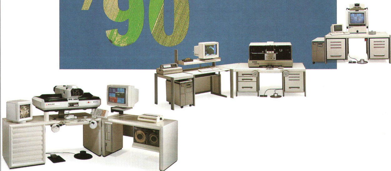
PHOTO GRAM METRY '90

WildLeitz (Schweiz) AG Kanalstrasse 21 · 8152 Glattbrugg · Tel. 01/809 33 11 Rue de Lausanne 60 · 1020 Renens · Tél. 021/635 35 53