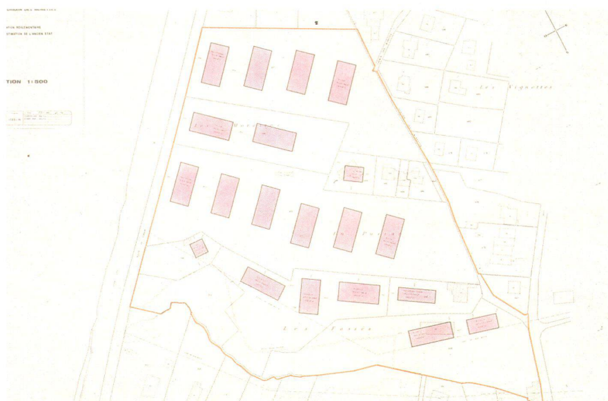
Fig. 1: Possibilités maximales de bâtir selon le règlement de 1966. Les bâtiments se gênent mutuellement, les espaces ne sont pas organisés.

Il en est résulté quelques difficultés pour mener à bien le remaniement parcellaire. D'une part, certaines implantations d'immeubles étaient mal choisies par rapport à l'état de propriété, ce qui a entraîné des soultes d'un montant indésirable. D'autre part, l'étude détaillée des travaux collectifs d'équipement a montré que certaines modifications étaient souhaitables, notamment au niveau des largeurs de chaussée et de l'emplacement des trottoirs.