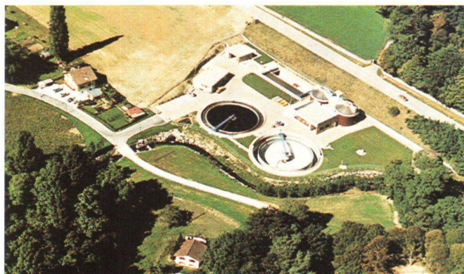
Fig. 2: Le génie de l'environnement.