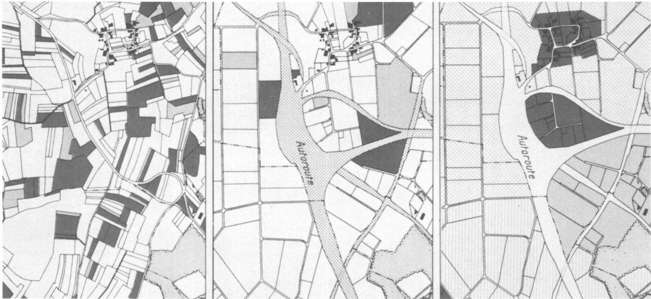
Fig. 3: Exemple d'un remaniement en corrélation avec l'aménagement du territoire et l'implantation d'une autoroute, concernant les communes de Villars-Ste-Croix, Bussigny et Crissier (canton de Vaud).

Le plan des zones définit clairement les différentes zones d'affectation.