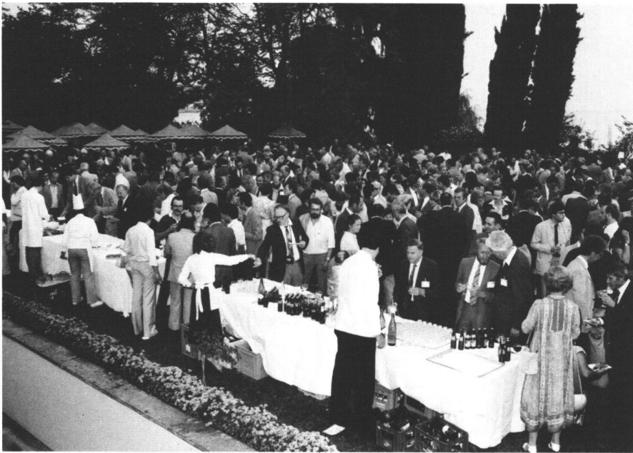
Ausstellerempfang Réception des exposants Exhibitor's reception