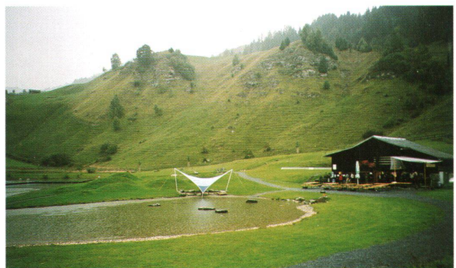
Abb. 2: Das Lugnez setzt auf umweltverträglichen Tourismus: Bau eines naturnahen Badesees bei Davos-Munts («Hinter dem Berg») oberhalb von Vattiz.