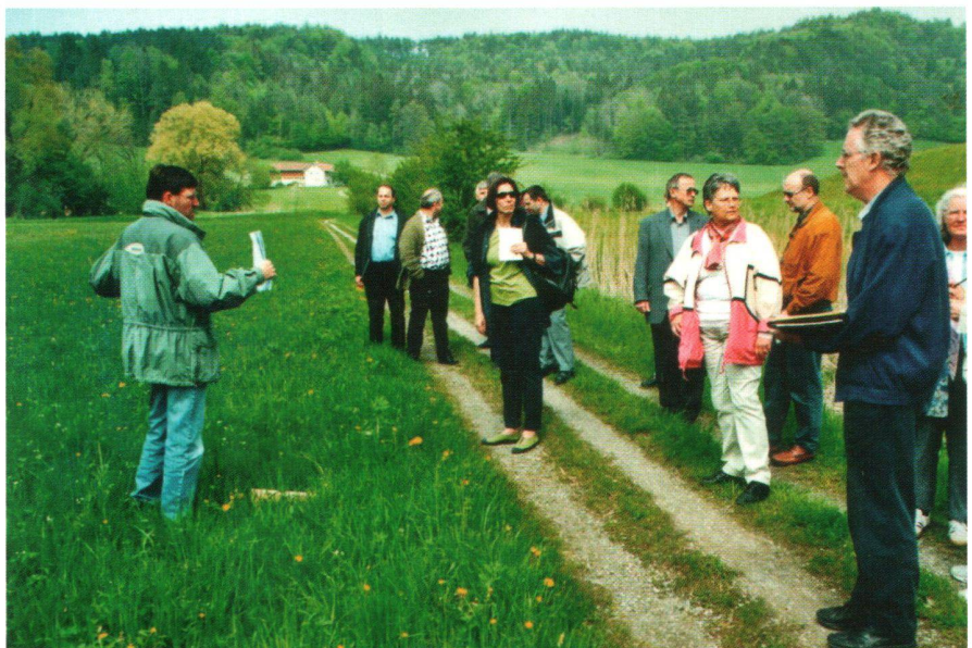
Abb. 1: Die Raumplanungskommission am Anwiler Ried, einem wichtigen Kerngebiet im Vernetzungssystem der Region Wil.

Die vom Kanton beauftragten Fachplaner entwarfen Konzeptkarten zu den The-