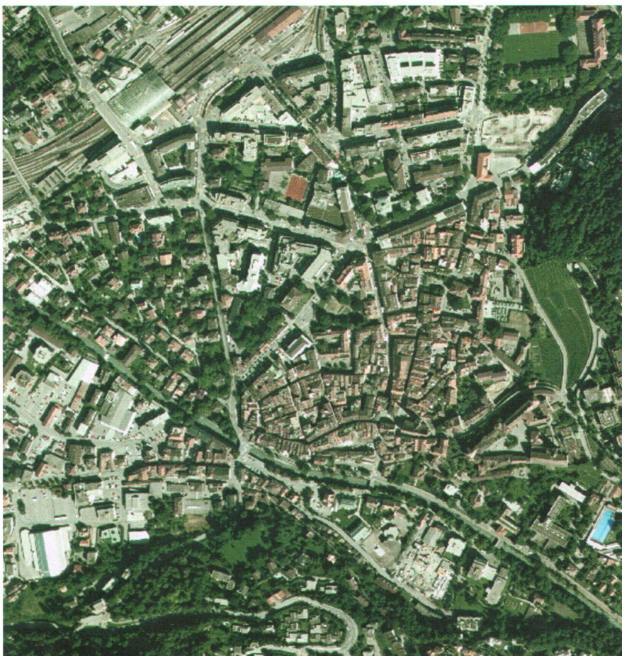
Abb. 1: Luftbild Chur.

Die noch intensivere Nutzung des Bodens, so z.B. für eine unmittelbare wirtschaftliche Nutzung, entspricht dem Sondernutzen. Dieser verlangt somit eine höhere Abgeltung. Beim sinngemässen Datenangebot könnten damit z.B. Einwohnerzahlen und deren Altersstruktur, verteilt im Hektarraster über das Siedlungsgebiet, vergleichbar sein. Neben den Aufwen-