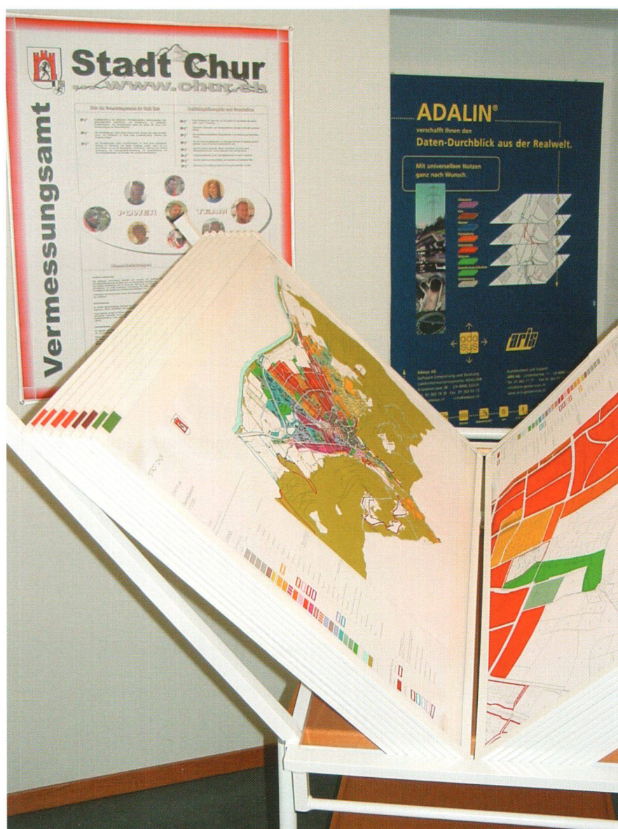
Abb. 3: Planprodukte.

Der Internet-Auftritt mit den geographischen Daten war für uns nicht nur ein wichtiger Meilenstein innerhalb des GIS-