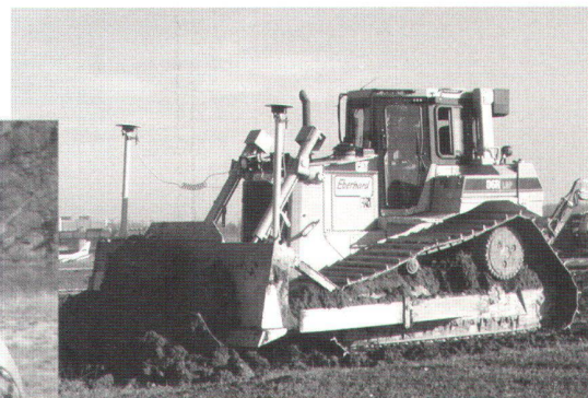
SiteVision - Automatische Maschinenführung