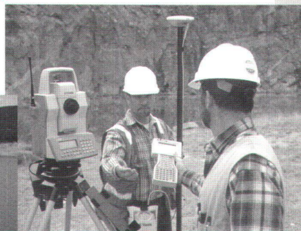
Trimble 5600 - Robotik-Tachymeter