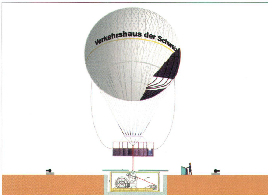
Abb. 3: Der Hiflyer im Verkehrshaus. Das Helium in der Hiflyer-Hülle ist unbrennbar. Es sorgt für einen Auftrieb von fünf Tonnen. Nach Abzug des Gewichts von Hülle, Gondel, Kabel und Passagieren bleibt ein Auftrieb von einer Tonne, der den Ballon steigen lässt. Von der Winde unter der Plattform wird der Hiflyer wieder zurückgeholt. Die kleinen Winden dienen zum Verankern des Ballons über Nacht und bei Wind von mehr als 40 km/h.