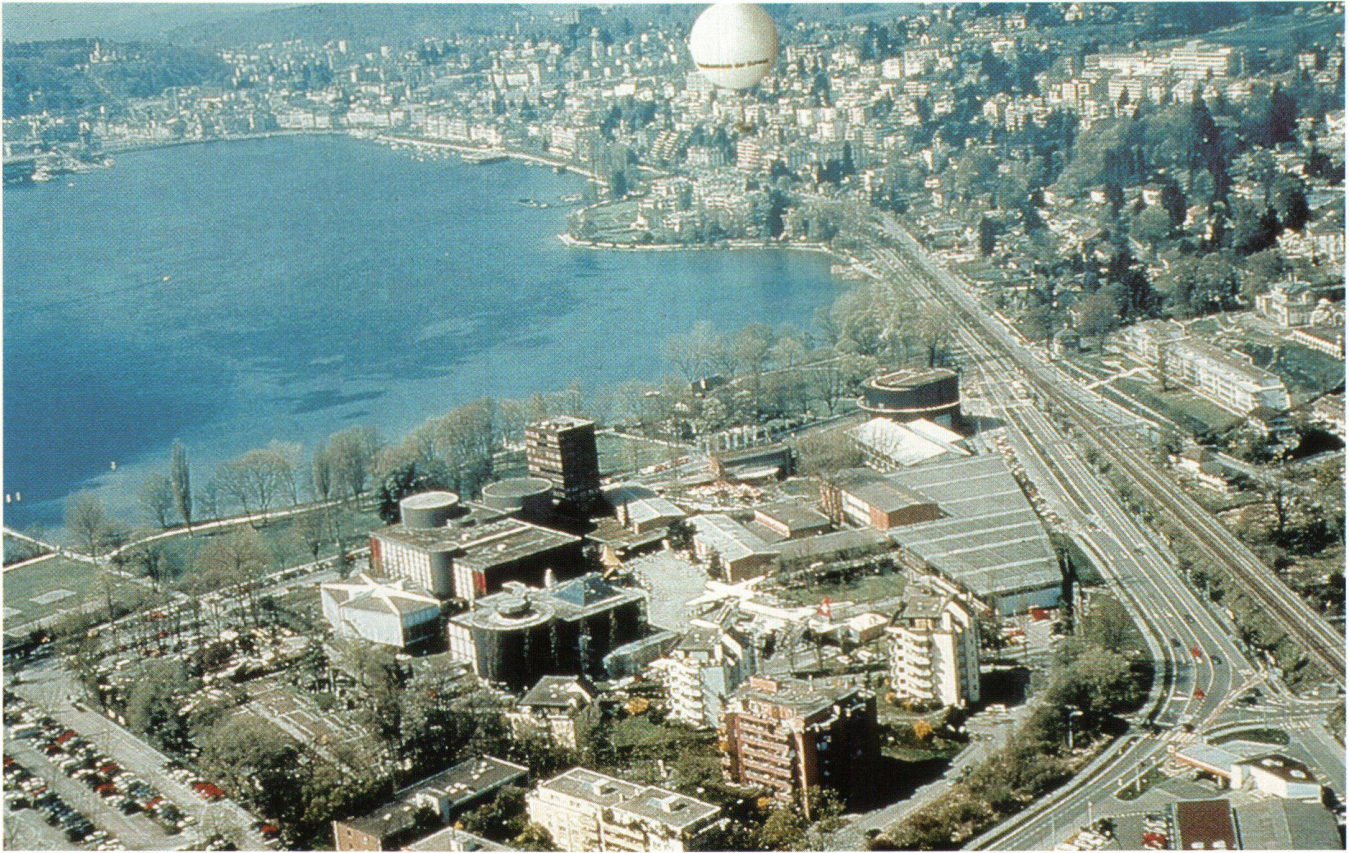
Abb. 4: Der Hiflyer über Luzern.

vielmehr, weil sich die Österreicher von diesem ersten militärischen Einsatz eines Ballons völlig demoralisieren liessen. Fesselballone waren aber nur beschränkt gefechtstauglich, denn die schwerfällige Vorrichtung, mit der – durch das Begiesen von Eisenspänen mit verdünnter Schwefelsäure – Wasserstoff gewonnen wurde, konnte im Kampfgeschehen nicht schnell genug verlagert werden. Die Schweizer Ballontruppe, die erst im Jahr 1900 gegründet wurde und bis 1938 bestand, hatte wegen des technischen Fortschritts mit anderen Hindernissen zu kämpfen: Telegraf- und Starkstromleitungen konnten von Fesselballonen nur mit grossem Aufwand überquert werden. Der Mann im Korb musste eines von zwei Transportseilen heraufziehen und auf der anderen Seite des Hindernisses herunterlassen, wo es von der Bodenmannschaft befestigt wurde, bevor das zweite Seil losgelassen und auf die gleiche Weise herübergezogen wurde. Aus diesem Grund wurden auch motorisierte Fesselballone