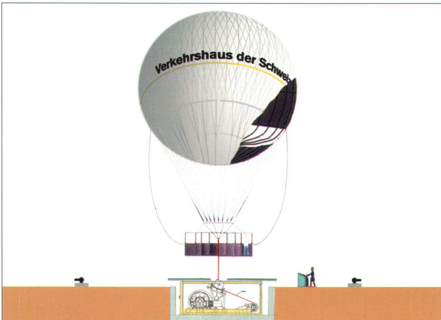
Abb. 3: Der Hiflyer im Verkehrshaus. Das Helium in der Hiflyer-Hülle ist unbrennbar. Es sorgt für einen Auftrieb von fünf Tonnen. Nach Abzug des Gewichts von Hülle, Gondel, Kabel und Passagieren bleibt ein Auftrieb von einer Tonne, der den Ballon steigen lässt. Von der Winde unter der Plattform wird der Hiflyer wieder zurückgeholt. Die kleinen Winden dienen zum Verankern des Ballons über Nacht und bei Wind von mehr als 40 km/h.